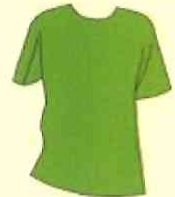
Tシャツ 襟なしシャツ タンクトップ