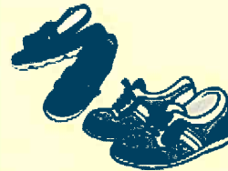
サンダル・運動靴