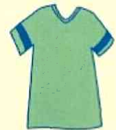
Vネックシャツ 襟なし