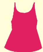
タンクトップ キャミソール